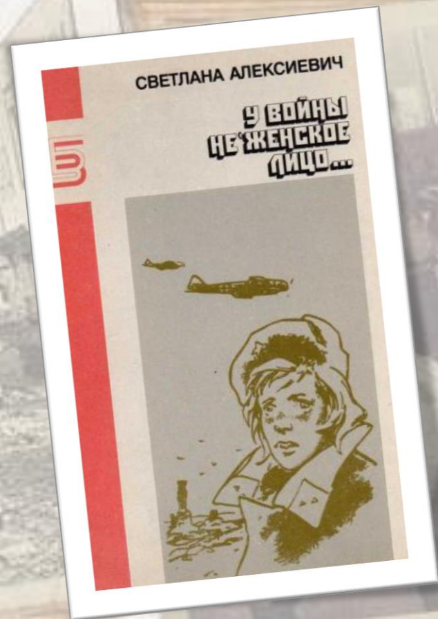
Светлана Алексиевич писательница, журналистка, сценарист документальных фильмов