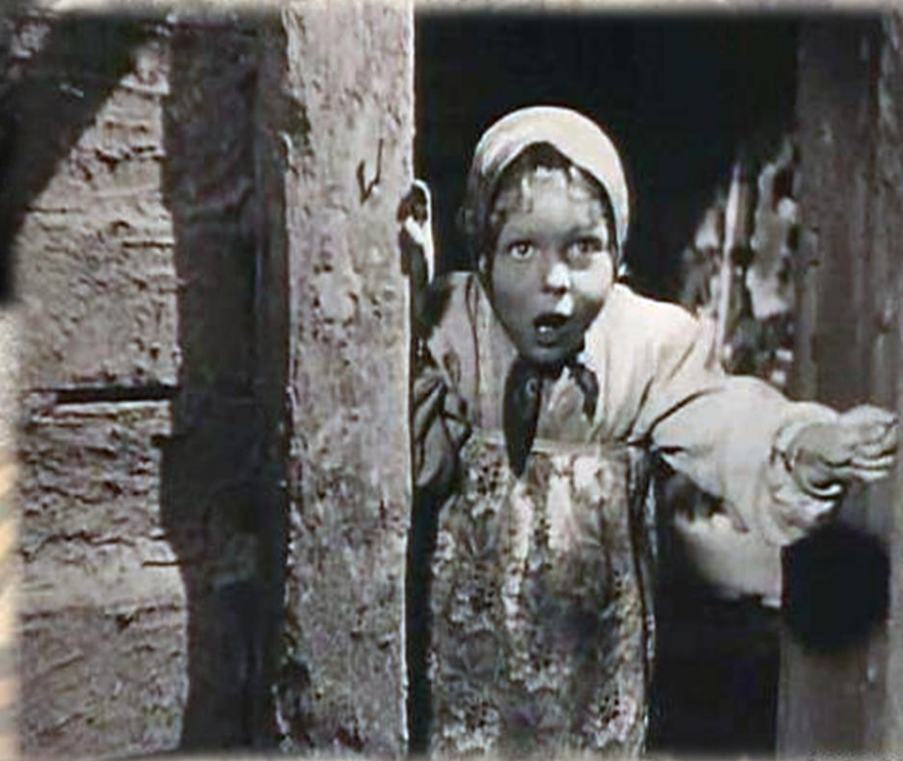
Гуля в к/к "Каштанка" 1926 год