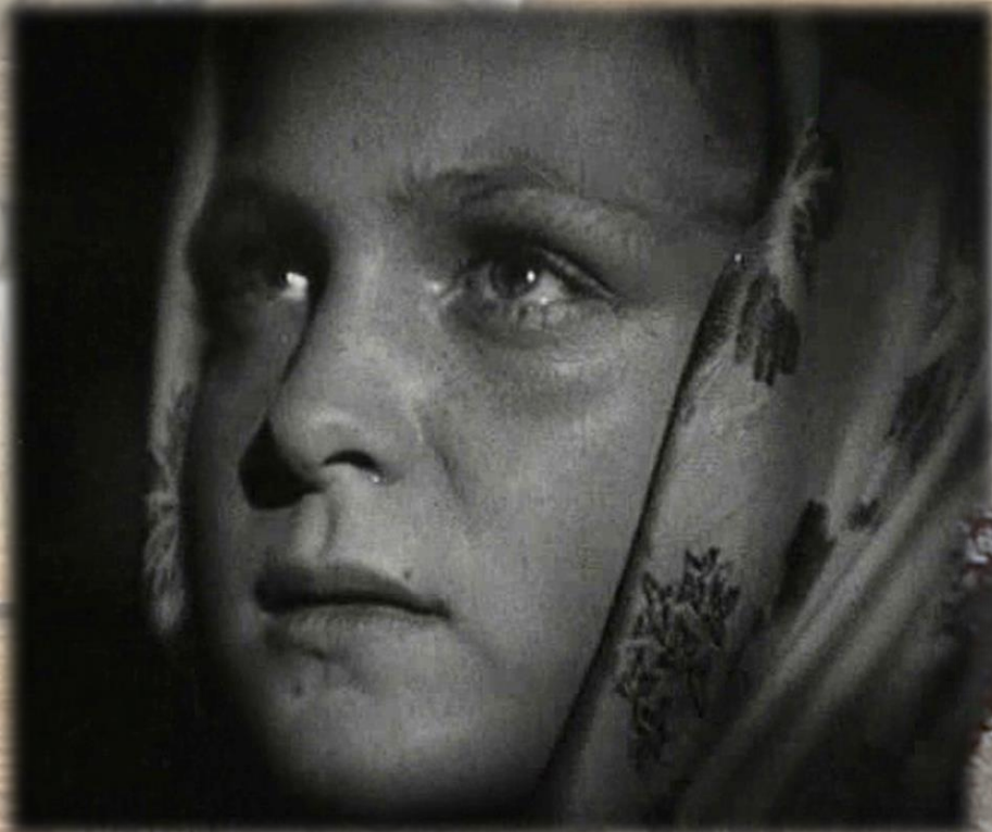
Гуля в к/к "Бабы рязанские" 1927 год.